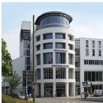
10/2016